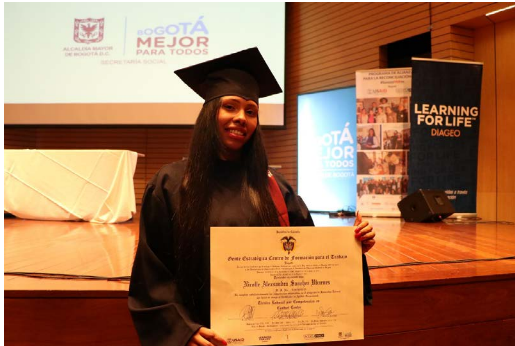
Ceremonia de Graduación en Bogotá, 2018