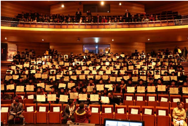
Ceremonia de Graduación en Bogotá, 2018