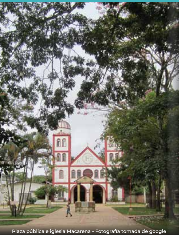
Plaza pública e iglesia Macarena